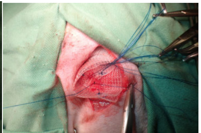
尾骨筋 肛門括約筋 靭帯 骨盤骨膜に固定