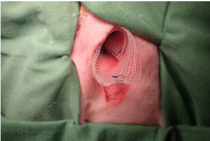
ヘルニアにメッシュを挿入