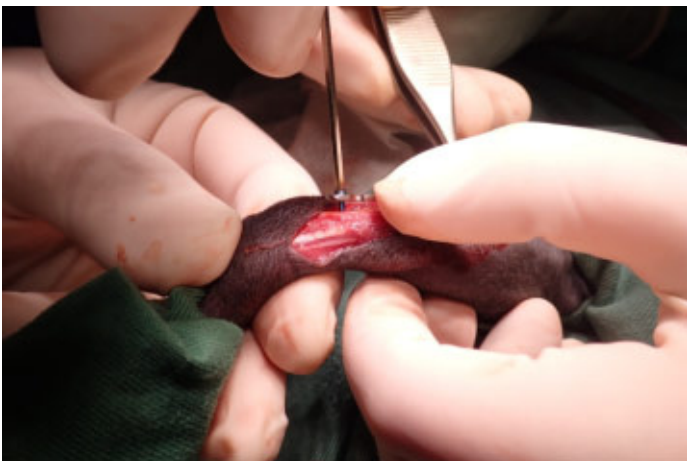
スクリューでプレートを固定