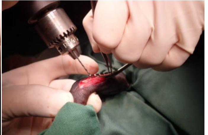
骨にスクリューの穴を形成